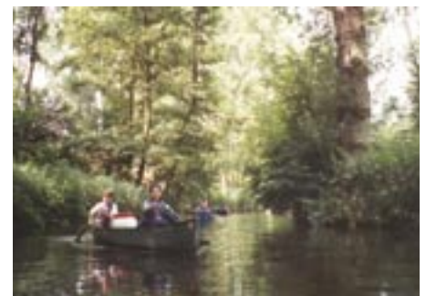
Découverte de l'Illwald au fil de l'eau.