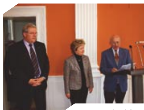
Les membres de l'AMOPA de passage à Sélestat