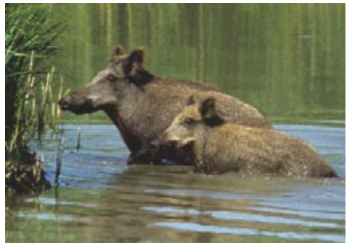
Sortie en famille au gré des méandres de l'Ill.