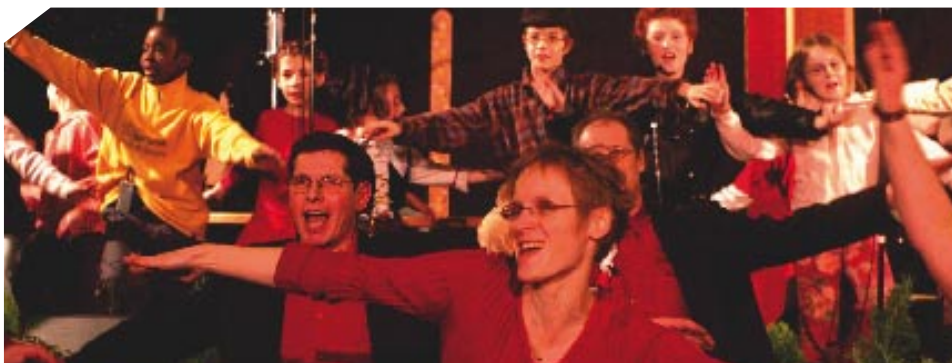
E Friejhohr fer unseri Sproch : un bel enthousiasme !