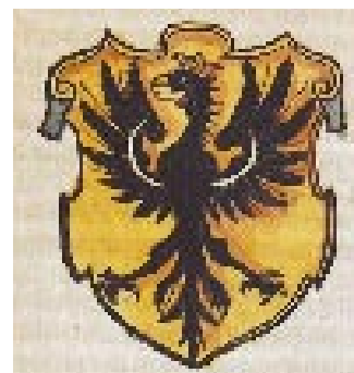
Ci-contre : blason à l'aigle extrait du Chronicon Alsatiae de Bernhart Hertzog (1592) (B.H.S., M 21 HER)

La Ville de Sélestat utilise encore de nos jours, pour ses courriers officiels et toutes les manifestations qu'elle organise ou dont elle est partenaire, un logo arborant le fier lion des ducs de Souabe. Remis aux goûts du jour, coloré et attractif, ce logo n'a rien perdu de sa superbe !