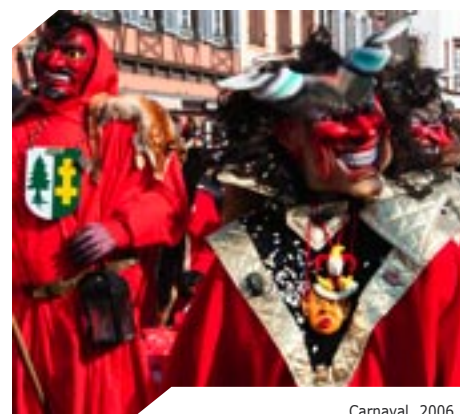
Carnaval 2006 : sensations fortes !