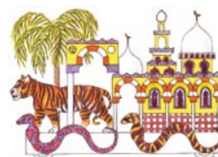
Char n°9 : la maison orientale