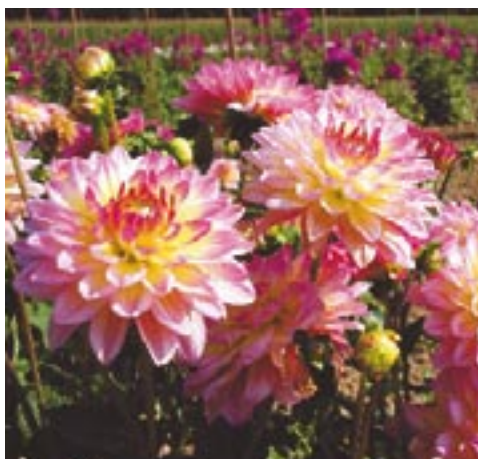
Décoratifs, pompons ou cactus... plus de 60 variétés de dahlias agrémenteront le jardin.

Un jardin dédié aux dahlias, on y songeait depuis longtemps. Il sera inauguré le 12 août prochain en filigrane du Corso Fleuri.