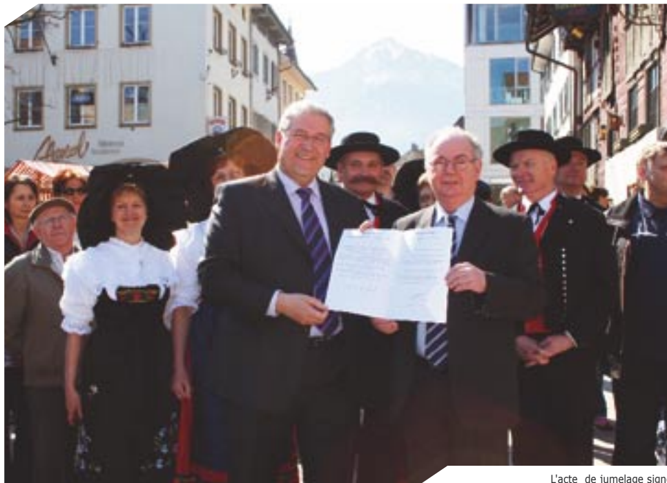
L'acte de jumelage signé entre Sélestat et Dornbirn