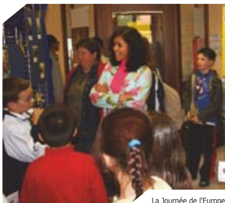
La Journée de l'Europe