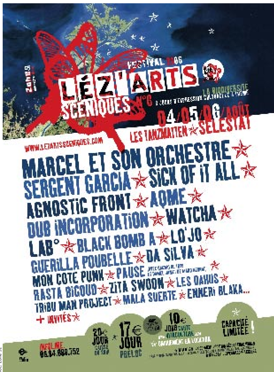
Doc. Zone 51

Les 4, 5 et 6 août, Lez'arts scéniques investissent pour la sixième année consécutive la scène des Tanzmatten. 9000 personnes et près de 300 artistes sont attendus pour ce festival de musiques nouvelles dont le thème sera cette année la biodiversité.