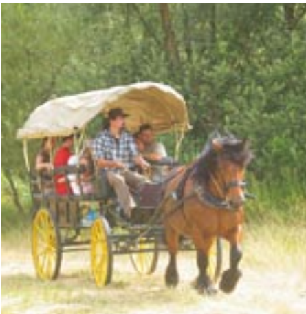
En famille ou entre amis, le Ried se découvre aussi en calèche !

Tout au long de la semaine, au jour le jour, l'Office de Tourisme de Sélestat s'investit pour vous proposer des activités originales et variées. En point d'orgue cette saison, quelques nouveautés que les inconditionnels de rencontres et d'aventures inédites sauront apprécier à leur juste valeur.