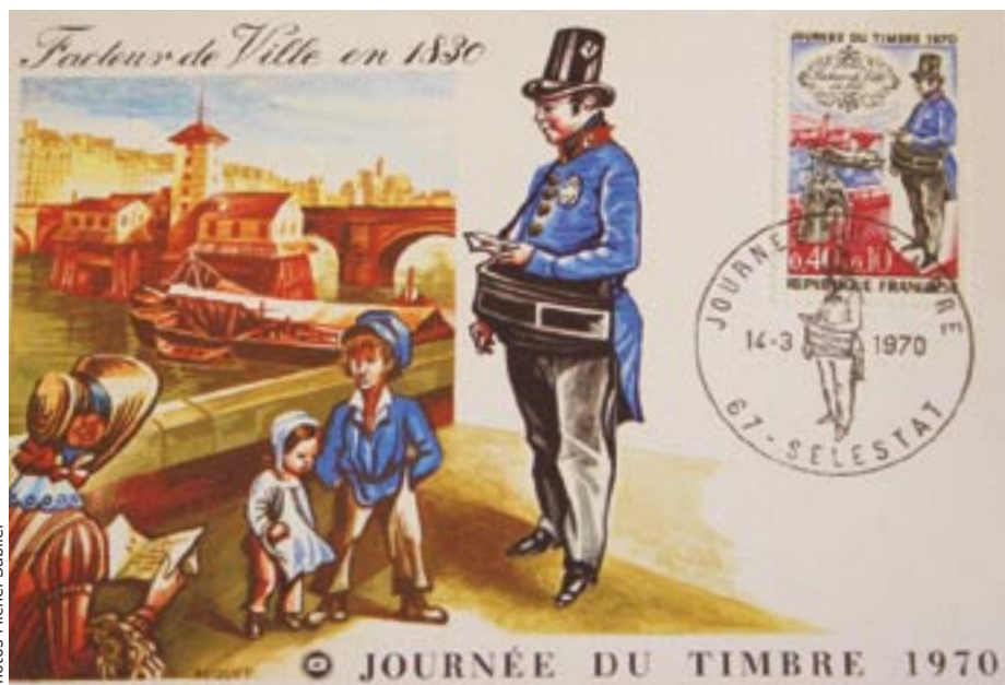
Enveloppe et timbre édités à l'occasion de la Journée du timbre en 1970 avec le cachet de la Ville de Sélestat.

L'Amicale Philatélique de Sélestat et Environs fête cet automne son 65 e anniversaire. 70 membres, dont une vingtaine très actifs, collectionneurs passionnés, écumant salons et bourses d'échanges, scrutent journaux spécialisés et sites Internet à la recherche d'un timbre ou d'un cachet rare... une vraie passion !