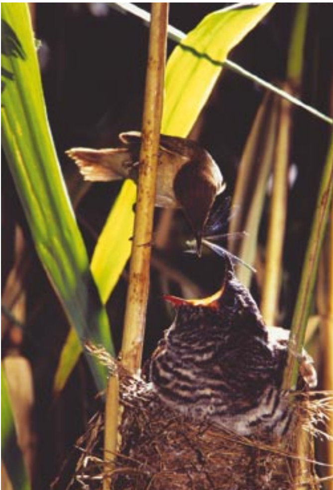
Le coucou, mauvais coucheur, nourri par une rousserolle.