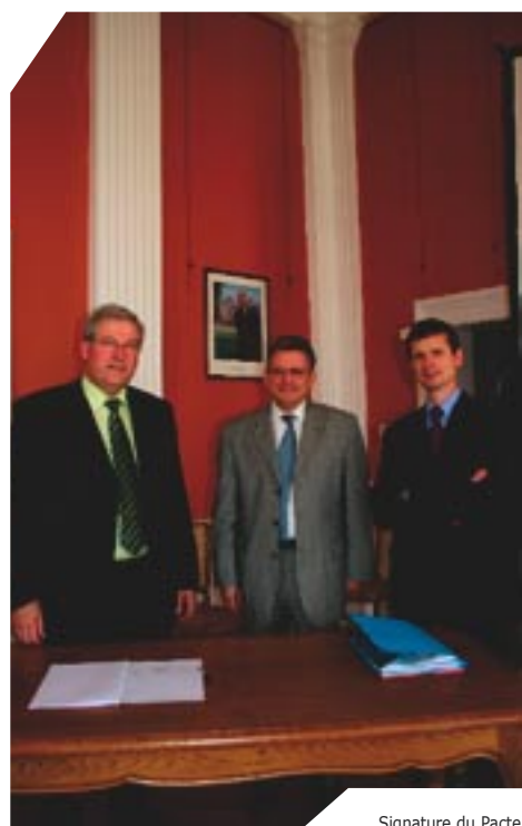
Signature du Pacte Territorial pour l'Insertion des Travailleurs Handicapés en présence du Délégué Interministériel Patrick Gohet