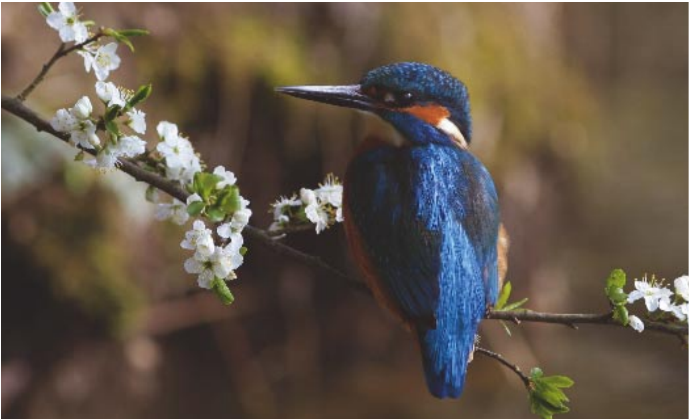
Un martin-pêcheur croqué sur la pellicule dans l'exubérance printanière !