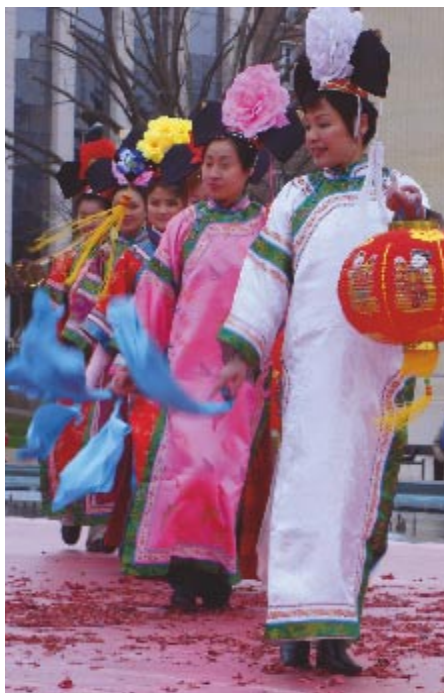
La troupe chinoise Fleuve Bleu : douceur et poésie !

Si les deux défilés de jour et de nuit font la part belle aux chars ornés de leurs 500 000 dahlias, les compagnies de rue et groupes musicaux ne sont pas en reste. Ils vont vous offrir un spectacle surprenant, drôle, loufoque parfois.