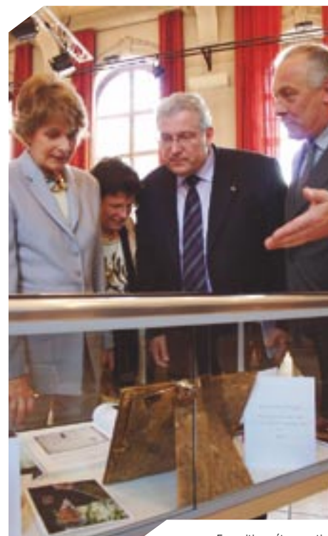
Exposition rétrospective Lazare Weiller