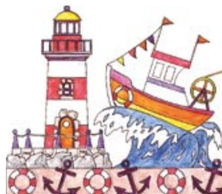
Maquette du char n° 3 : le phare.