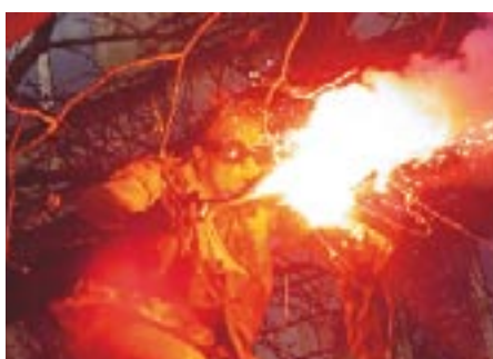
La compagnie Cramoisie : un spectacle décapant !