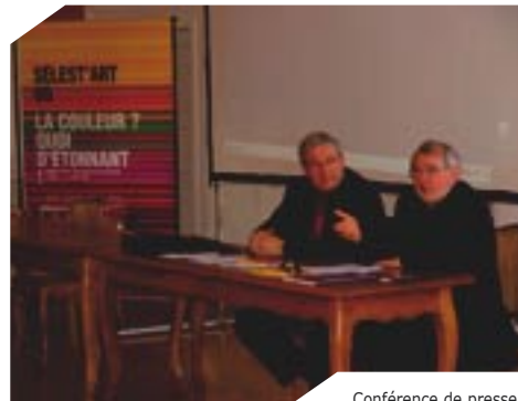
Conférence de presse bilan Sélest'art