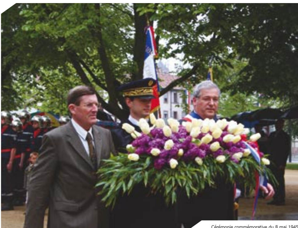
Cérémonie commémorative du 8 mai 1945