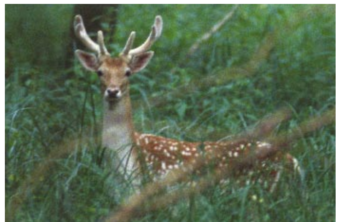
Le daim, animal emblématique de l'Illwald.