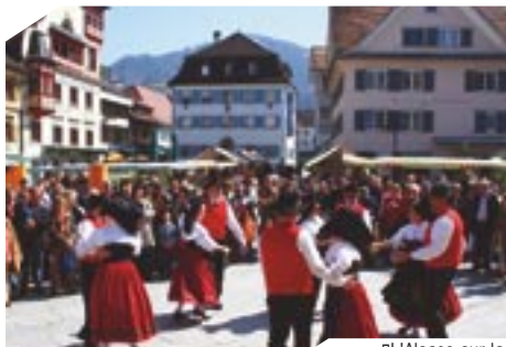
Le tableau de Jean-Claude Klinger offert au Maire de Dornbirn sur la place du marché de Dornbirn !