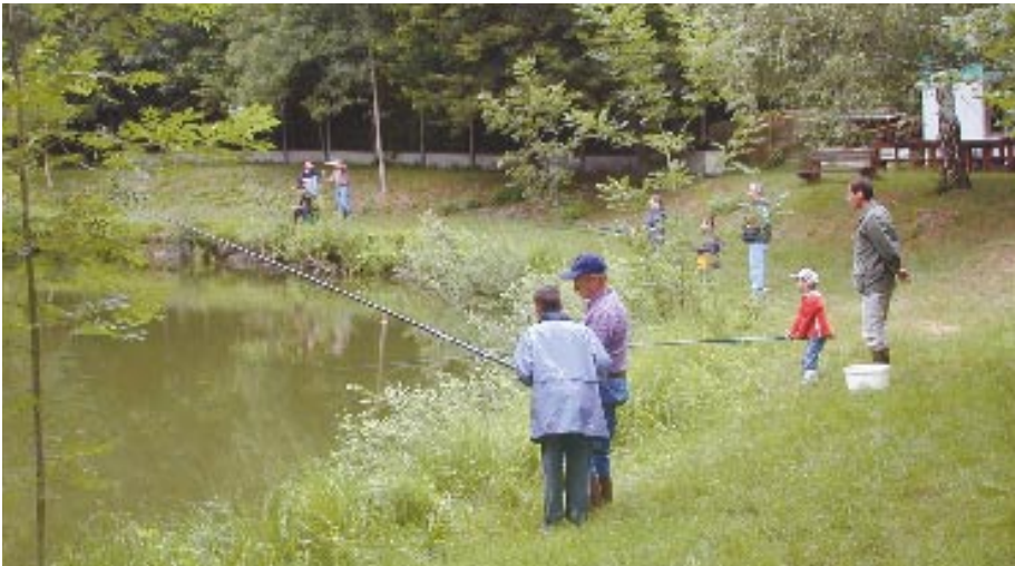
Toute la joie de la pêche estivale en famille !