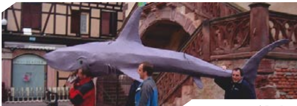
Après l'hiver, l'envers, vous avez dit "décalée", la manifestation ?