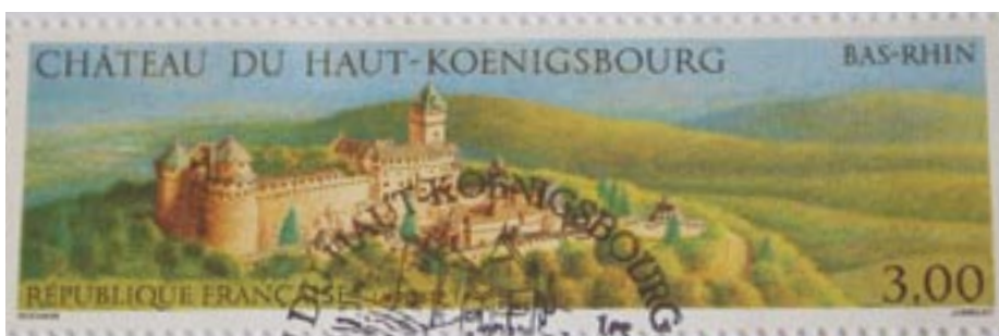
L'Amicale est à l'origine du timbre consacré au Haut-Koenigsbourg en 1999... un nouveau timbre sur le thème de la Bibliothèque Humaniste est prévu pour 2007.