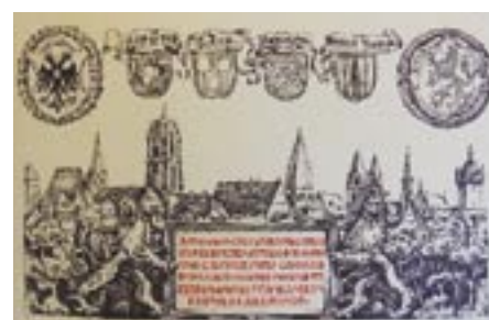
Ci-dessus et ci-contre : documents extraits de l' Armorial communal d'Alsace d'Alexandre Dorlan, dont le blason au lion daté de 1697