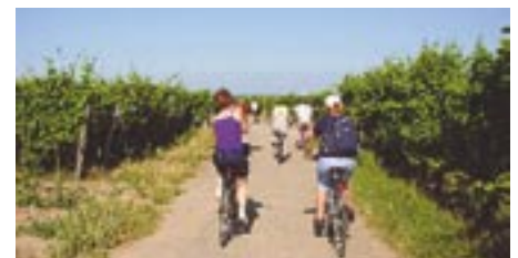
Possibilité de location de vélos à l'OT.

possibilité de location de vélos (adultes et enfants) de mai à octobre. Forfait semaine : 55 € , journée adulte 12,50€; journée enfant 8,50€.