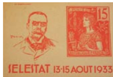
Document édité à l'occasion de la première manifestation philatélique à Sélestat.