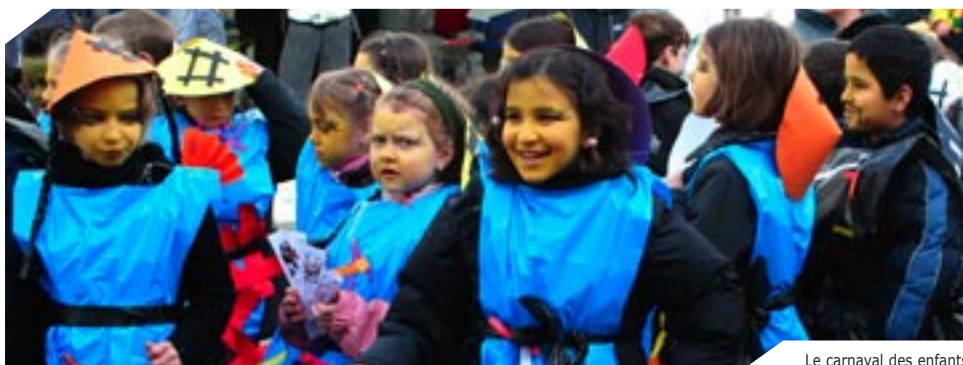
Le carnaval des enfants