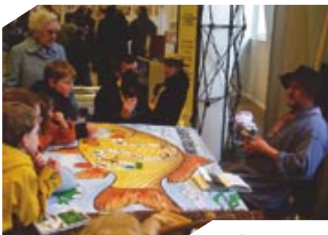
Après l'hiver, l'envers, pour le bonheur des enfants !