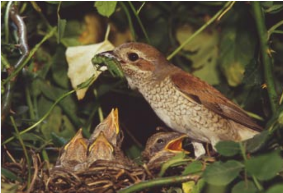
Une pie grièche nourrit sa progéniture bien cachée au coeur des fourrés.