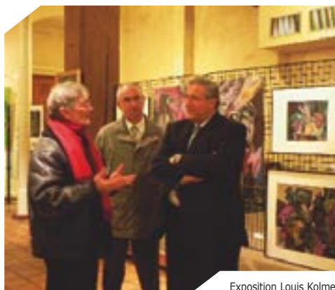
Exposition Louis Kolmer