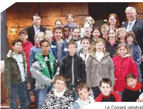
Le Conseil général dévoilé au CM des Enfants