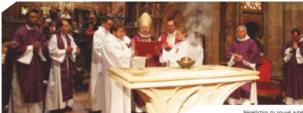
Bénédiction du nouvel autel de l'église Saint Georges