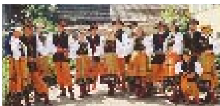
Avec le groupe Tatry : du folklore de qualité.

Animations parmi d'autres, les compagnies Alambic , Cramoisie , la troupe chinoise Fleuve Bleu ou encore le Théâtre de la Chimère vous réservent de belles surprises de jour comme de nuit !