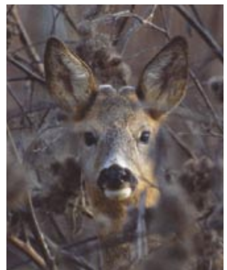
Surpris, le chevreuil !