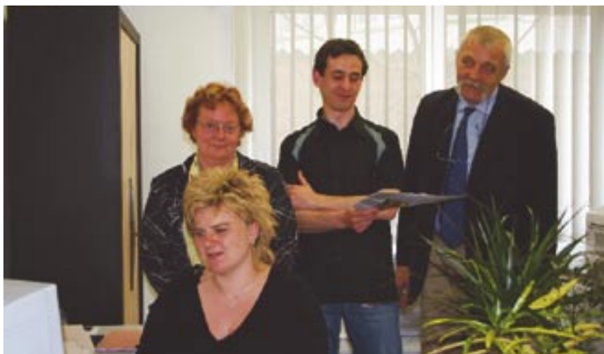
L'équipe de l'antenne du Heyden met un point d'honneur à se tenir informée des nouvelles dispositions mises en application afin de renseigner au mieux le public.

L'antenne de la mairie située dans le quartier du Heyden souffle ce printemps ses quatre bougies ! L'occasion de faire le point sur les missions et activités de ce service décentralisé rattaché au Centre communal d'action sociale de la Ville.