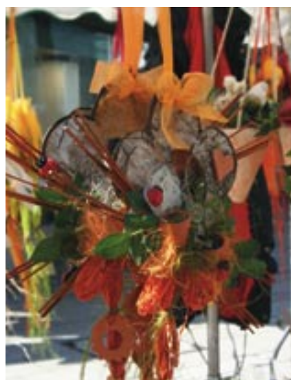
Bouquet ornemental découvert au coeur du Marché aux Fleurs du samedi matin.