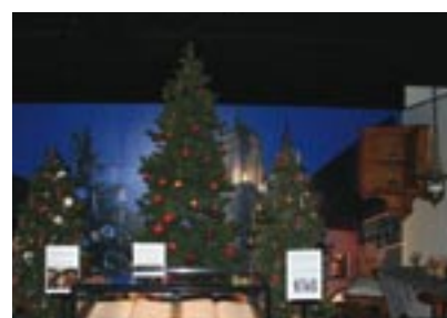
Le stand de la Ville de Sélestat à Rovaniemi