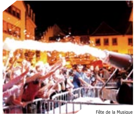
Fête de la Musique version été 2006