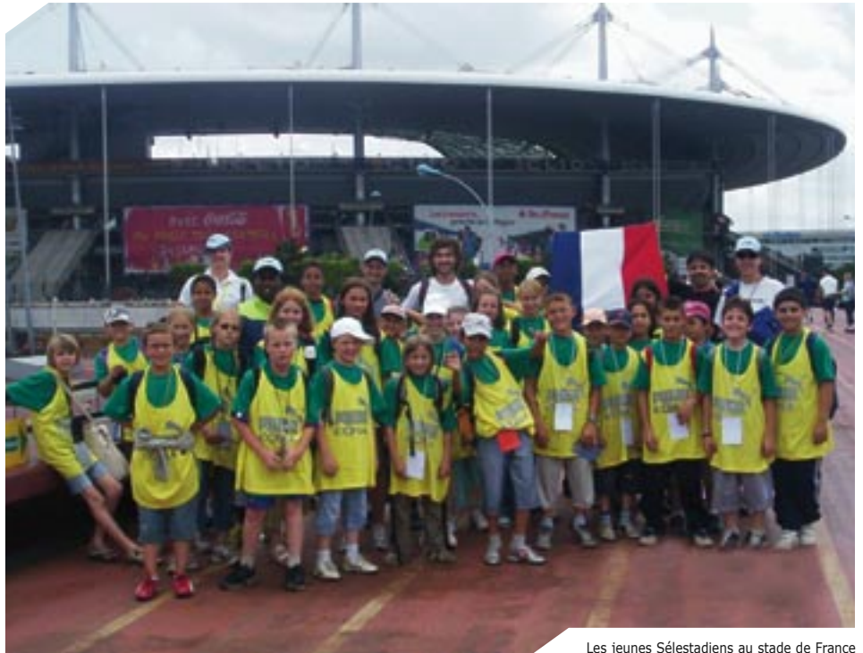
Les jeunes Sélestadiens au stade de France à l'occasion du meeting d'athlétisme Gaz de France