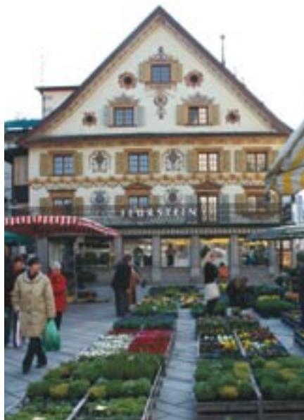
Un petit aperçu du marché aux Fleurs

Belle et dynamique... Dornbirn est une ville de charme et de contrastes de 45 000 habitants située à quelques encablures du lac de Constance, au pied du massif de la forêt de Bregenz.