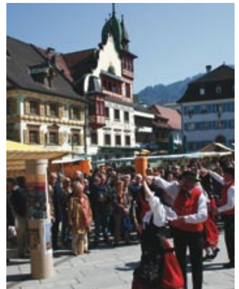
Le groupe folklorique du Haut-Koenigsbourg a été très applaudi par la foule autrichienne.