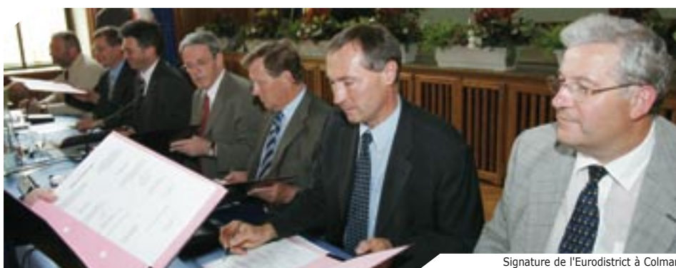
Signature de l'Eurodistrict à Colmar le 5 juillet dernier