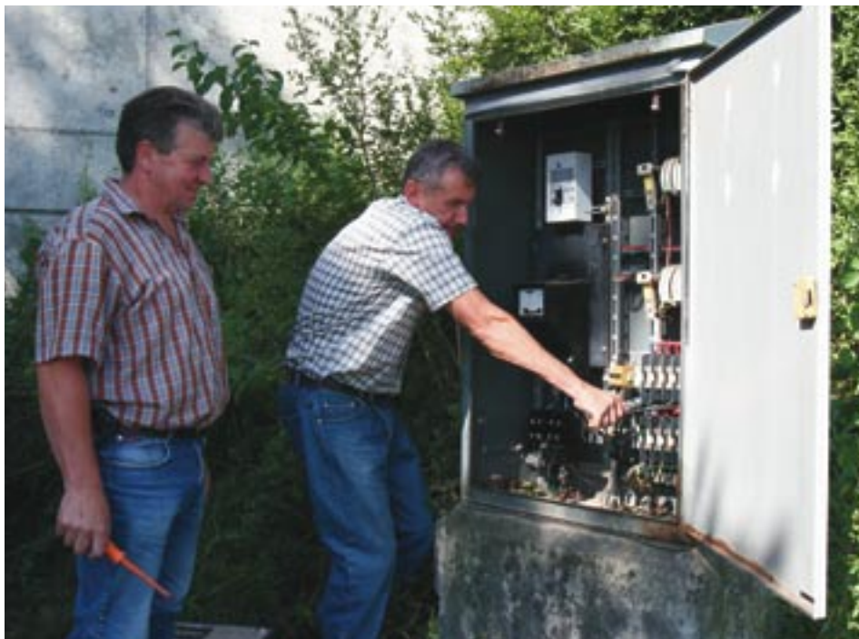
Les agents de la Ville réparent l'une des 43 armoires d'alimentation de Sélestat : ici route de Bergheim.

L'éclairage public fait tellement partie du paysage urbain qu'on en viendrait presque à oublier combien il est important dans la vie quotidienne des usagers. Dans leur déplacement, pour leur sécurité, dans la mise en valeur de leur patrimoine, la fée électricité participe, aujourd'hui encore, au bien-être de nos concitoyens.