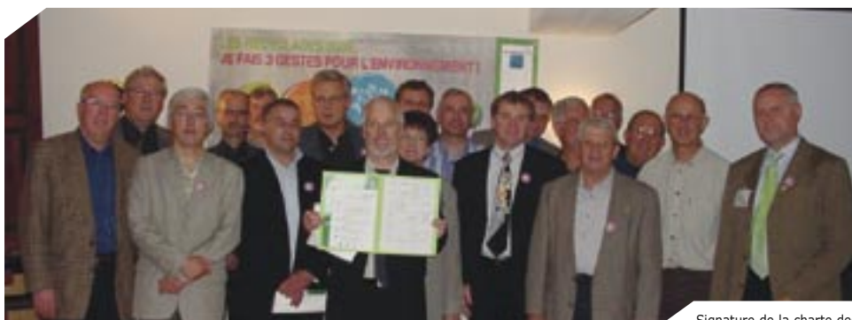
Signature de la charte des collectivités éco-responsables