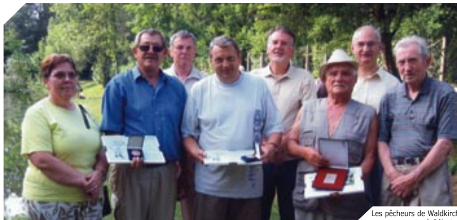
Les pêcheurs de Waldkirch à Sélestat