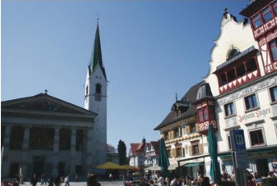
Vue générale du Marktplatz, le centre névralgique et convivial de la capitale du Vorarlberg.