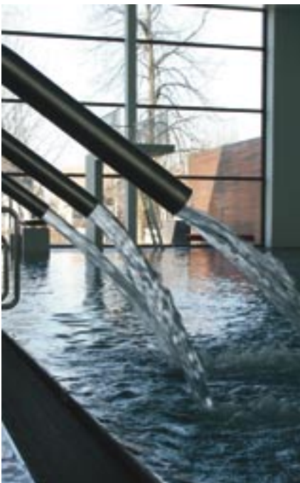
La nouvelle piscine de Dornbirn : lignes épurées, beaucoup de lumière, du design grande classe !