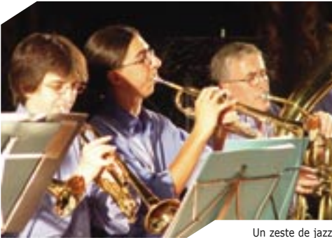
Un zeste de jazz pour les concerts du parvis