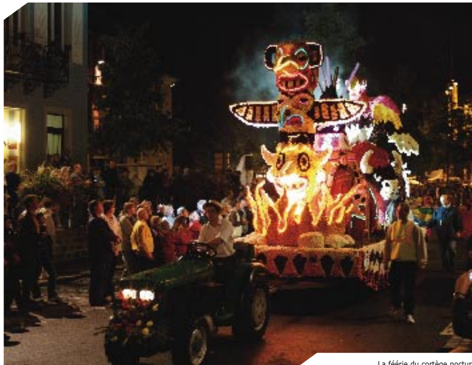
La féerie du cortège nocturne du Corso Fleuri