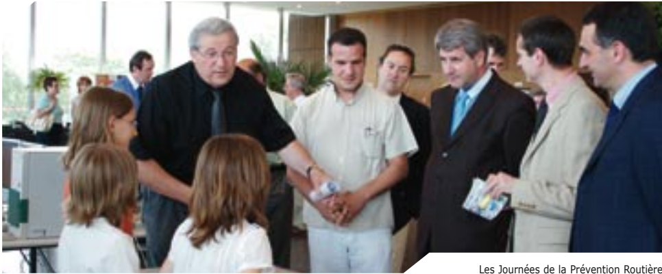
Les Journées de la Prévention Routière