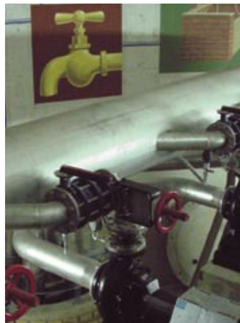
Ecran de contrôle (photo de gauche), vannes et tuyaux à l'intérieur de réservoir.