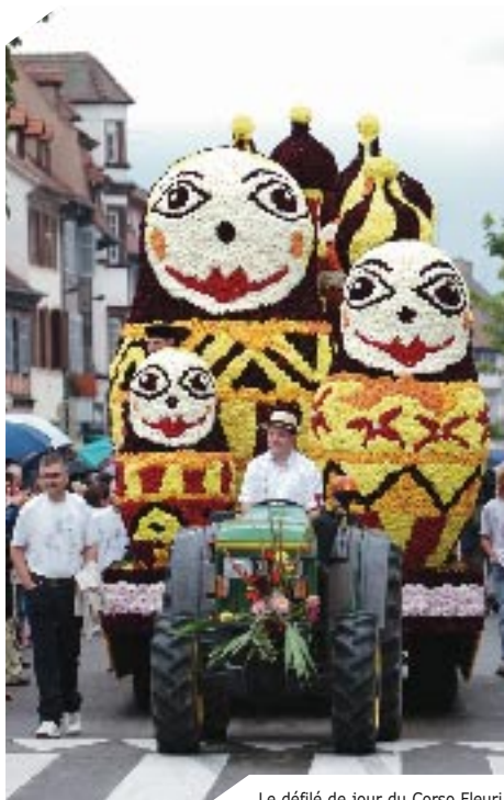
Le défilé de jour du Corso Fleuri