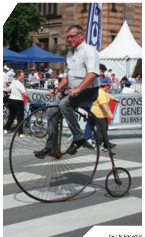
Tout le Bas-Rhin à vélo