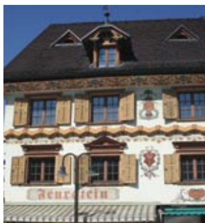
... et sur la Place du Marché, où les habitants aiment se retrouver.