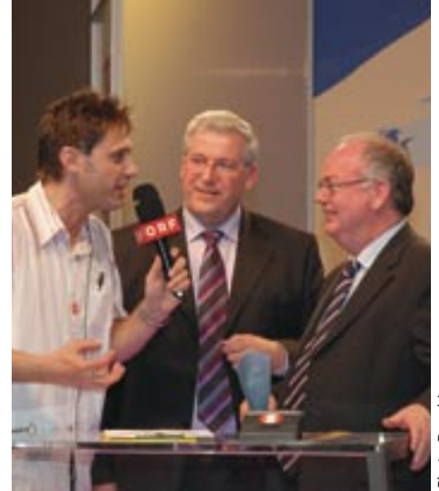
Interview des deux maires par le journaliste de la télévision autrichienne à la Foire de Printemps