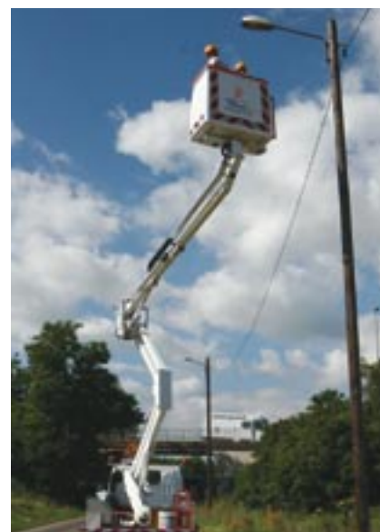
Pour mener à bien leurs missions, les agents disposent de deux nacelles de 17 et 21 m.

Ainsi le Neja Waj, le boulevard Amey, la route de Muttersholtz et la route de Sainte-Marie-aux-Mines bénéficient désormais de luminaires esthétiques et peu gourmands en énergie qui diffusent la lumière de manière très efficace !