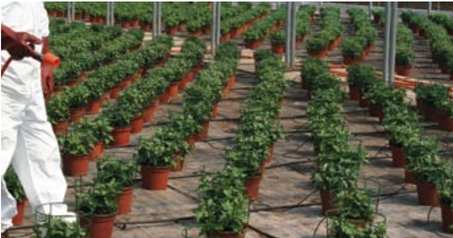
Épandage de produits phytosanitaires dans les serres de la Ville : toutes les précautions sont prises pour protéger à la fois les agents et réduire au maximum l'utilisation des traitements nuisibles à l'environnement.

Très impliquée en matière de développement durable, la Ville de Sélestat joue la carte de l'environnement au sein de ses services. Illustration dans divers domaines d'activité.