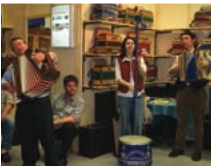
Instant volé à la Foire de Printemps !