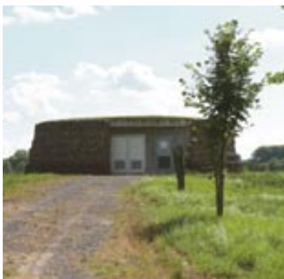
Le réservoir Obere Erlen en lisière de l'Illwald : 800 m 3 eau/heure.

Le nouveau système mis en place par Véolia permettra également une meilleure visualisation des fuites sur le réseau grâce à des détecteurs et donc un meilleur rendement. Qui dit fuites jugulées dit moins de quantité d'eau consommée et donc un environnement préservé !