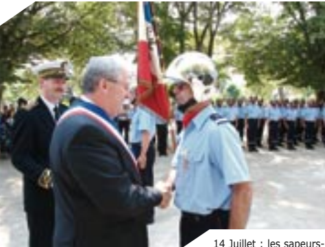
14 Juillet : les sapeurs- pompiers à l'honneur