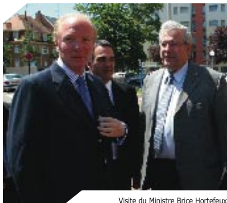
Visite du Ministre Brice Hortefeux