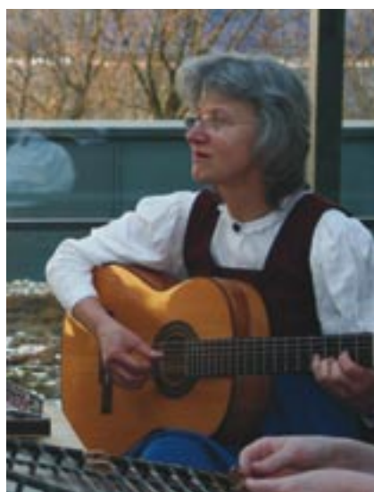
Contemporaine ou traditionnelle, à Dornbirn, on aime la musique sous toutes ses formes !