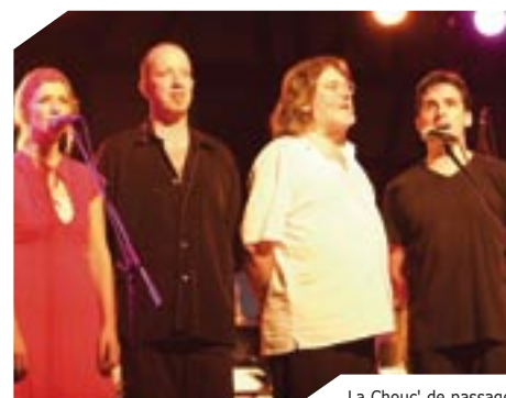
La Chou' de passage à Sélestat