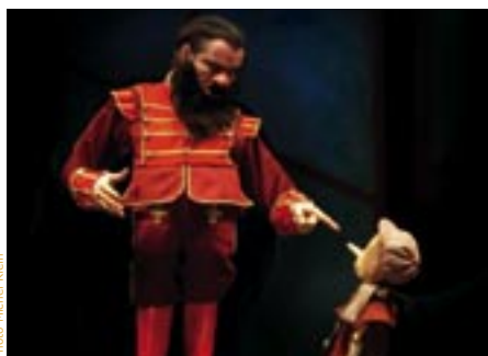
Pinochio - Spectacle jeune public