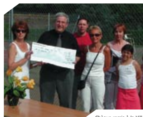
Chèque remis à la Ville par le club de tennis