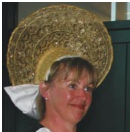
Coiffe traditionnelle pour sourire contemporain !