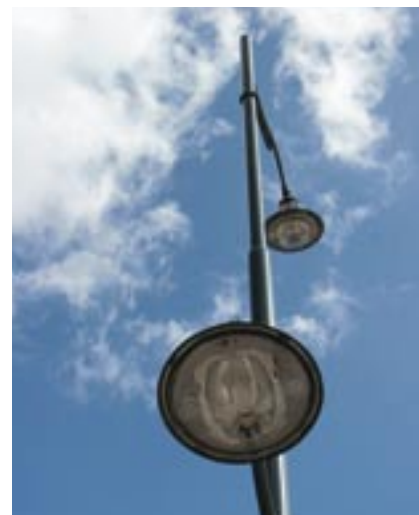
Design, haute performance et économie d'énergie pour les nouveaux luminaires du Neja Waj.