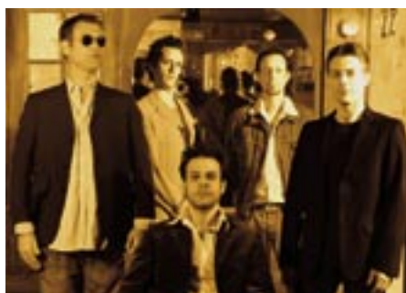
Le Groupe Padam - Chansons en Herbe

Les billets sont à retirer à l'avance aux Tanzmatten, aux heures d'ouverture de la billetterie.