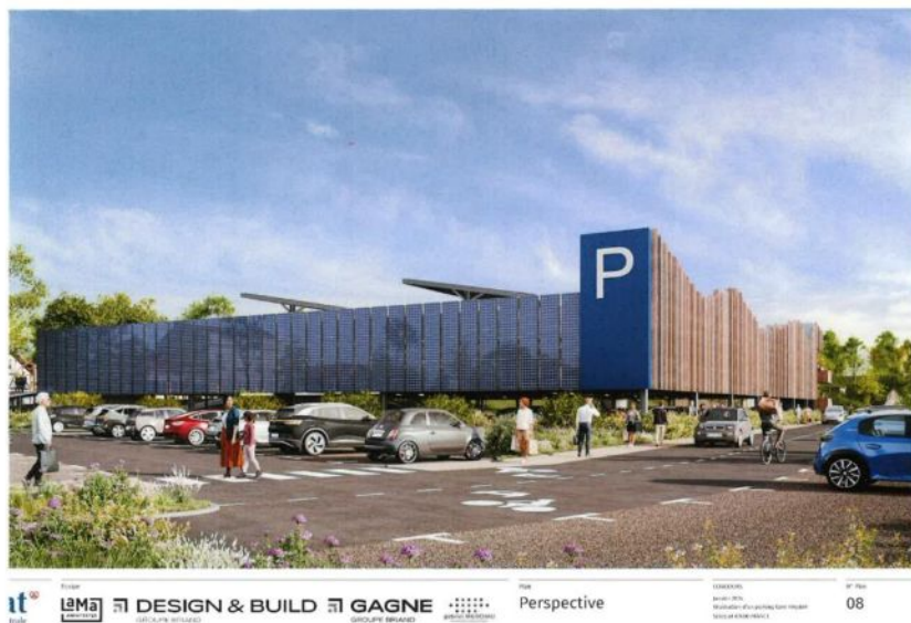
EMPLACEMENT PARKING SILO SELESTAT