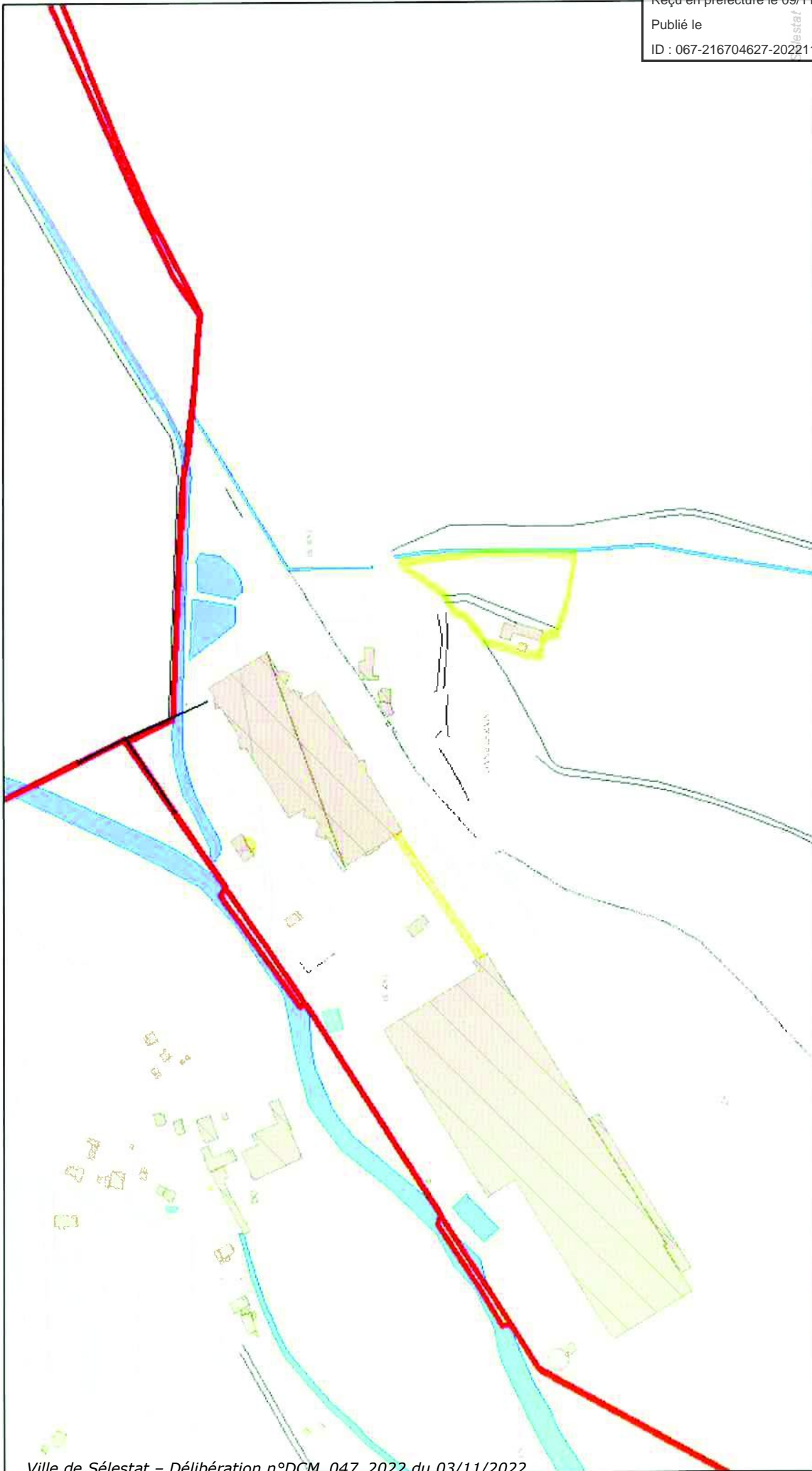
plan de situation